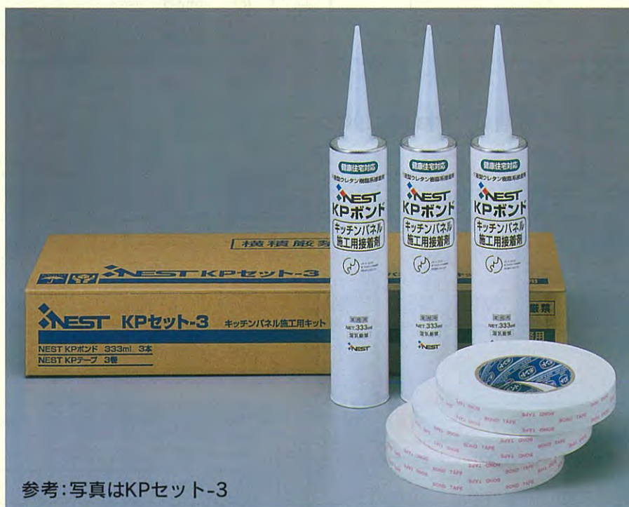
参考：写真はKPセット-3

強力両面テープで仮止め（1次接着）、弾力性接着剤で固定（2次接着）する接着工法は、仮釘の必要が無く簡便な施工方法です。