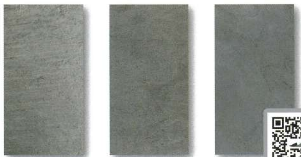
SL-57 / SLS-57 SEA GREEN シーグリーン