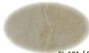
SL-101 / SLS-101