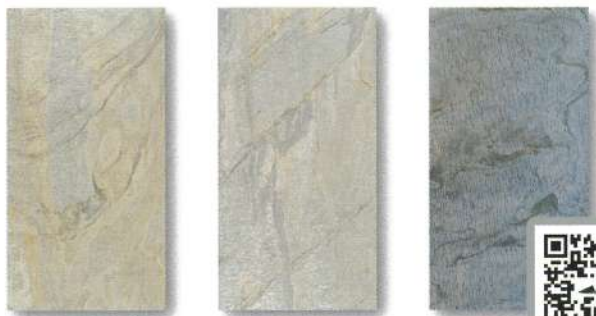
SL-58 / SLS-58 VERDE ベルデ