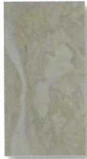
SL-101 / SLS-101 TAN YELLOW タンイエロー