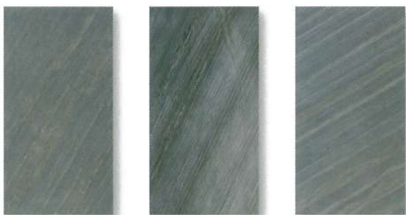
SL-53 / SLS-53 D-BLACK ディーブラック