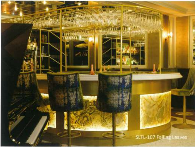
SLTL-107 Falling Leaves