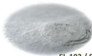
SL-103 / SLS-103