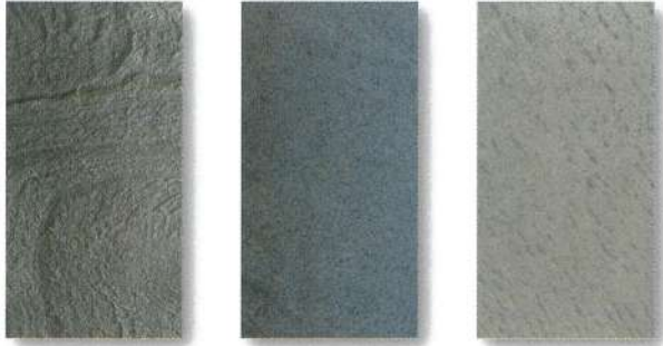
SL-59 / SLS-59 SILVER GALAXY シルバーギャラクシー