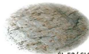
SL-52 / SLS-52