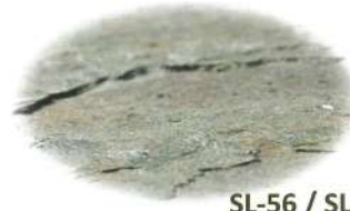
SL-56 / SLS-56