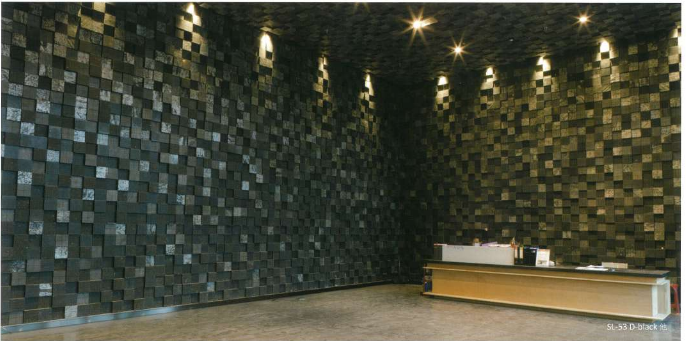
SL-53 D-black 他