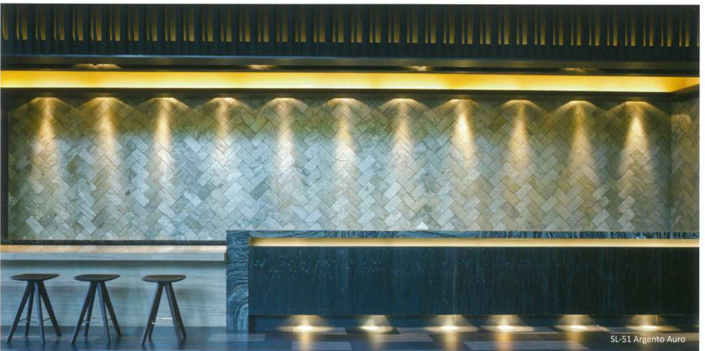
SL-51 Argento Auro