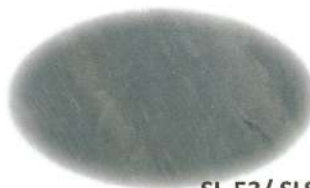
SL-53 / SLS-53