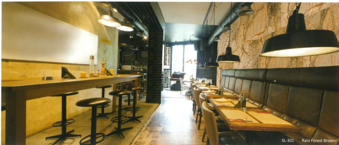
SL-301 RAIN FOREST BROWN レインフォレストブラウン

ウッディな色柄が特徴のインド産大理石、レインフォレストブラウン。熱帯雨林と砂漠地帯を併せ持つ広大なインドをそのまま表現した様な表情が特徴。