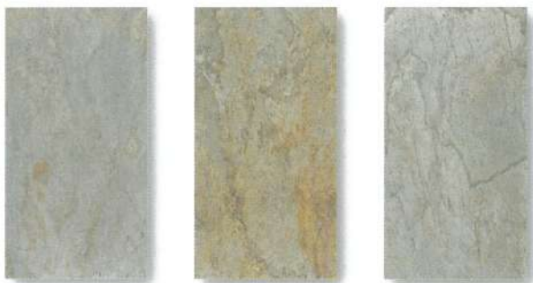
SL-51 / SLS-51 ARGENTO AURO アルジェントオーロ

パール感のあるマイカ(雲母)が多く含まれており、表面の凹凸がマイカタイプの特徴の一つです。薄いシート状でありながらその凹凸感が厚みと奥行きを感じさせます。