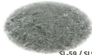
SL-59 / SLS-59