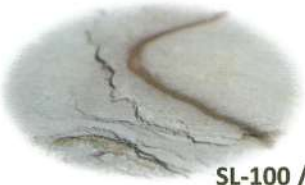
SL-100 / SLS-100

マットな質感で、粘土質の粒子が堆積し長い年月をかけて出来上がったユニークな模様が特徴です。 ミルフィーユ状に層が重なり合っている為、色柄の違いが大きく天然石ならではの風合いと質感をご堪能いただけます。