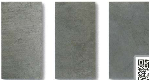
SL-57 / SLS-57 SEA GREEN シーグリーン