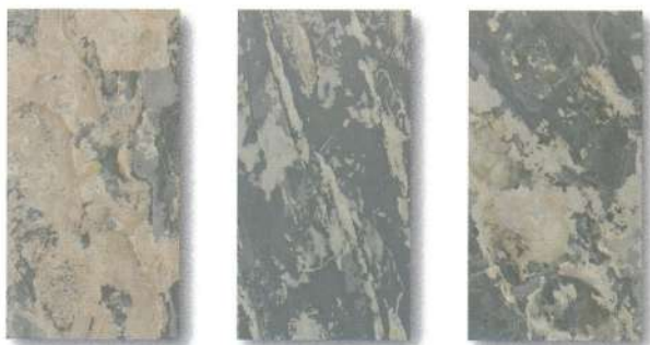
SL-106 / SLS-106 RUSTIQUE ラスティック