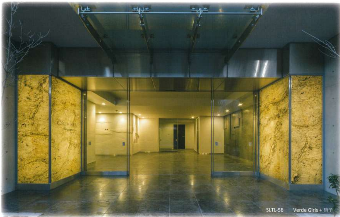
SLTL-56 Verde Girls + 硝子