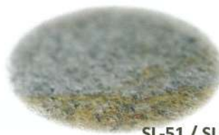
SL-51 / SLS-51