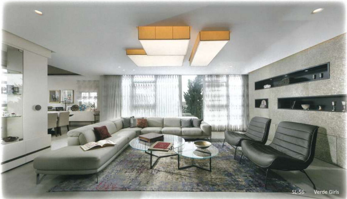
SL-56 Verde Girls