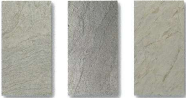
SL-56 / SLS-56 VERDE GRIS ベルデグリス