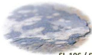
SL-106 / SLS-106