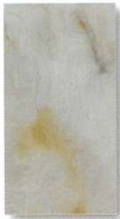
SL-100 / SLS-100 BLANCO ブランコ