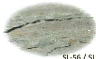
SL-56 / SLS-56