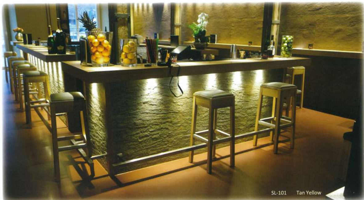
SL-101 Tan Yellow