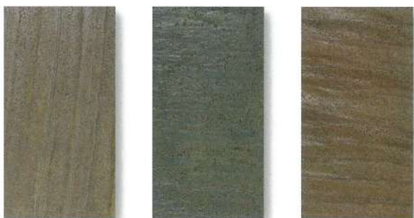
SL-52 / SLS-52 COBRE コブレ